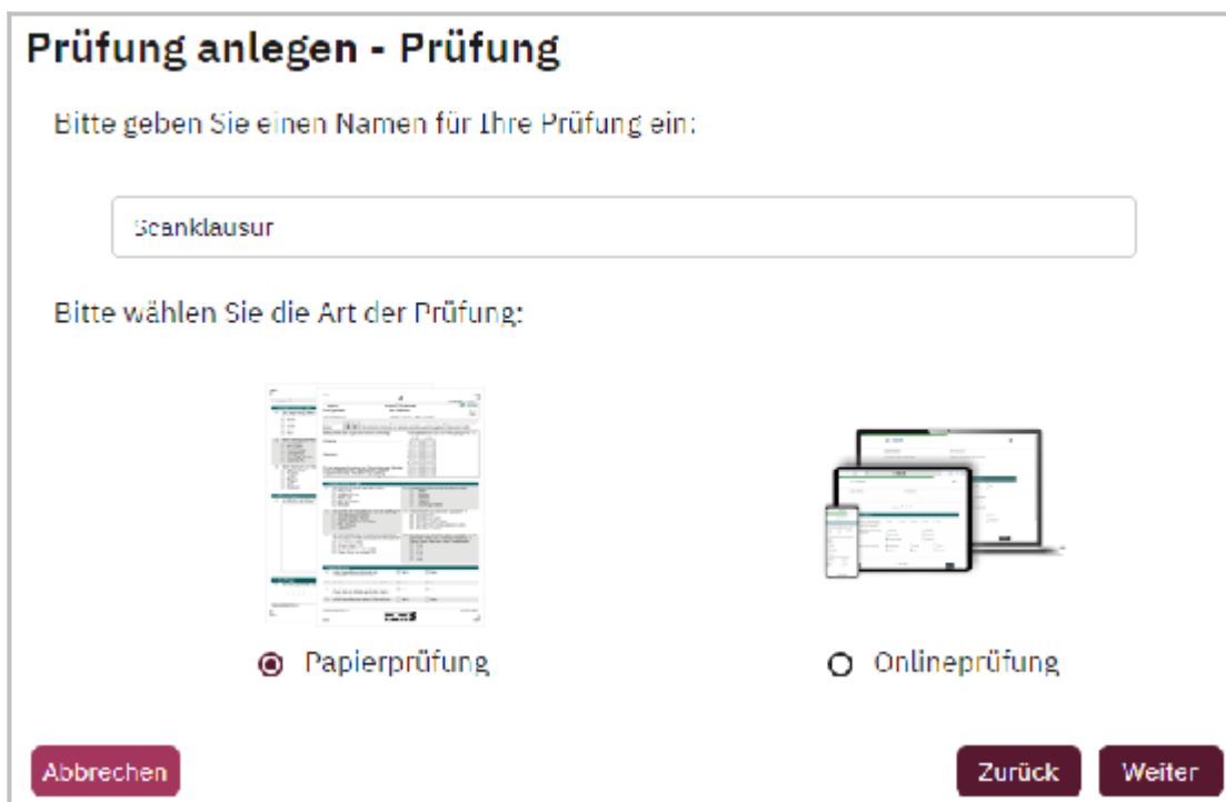
Abb. 2: Prüfungsordner anlegen → Namen vergeben und Papierprüfung auswählen

Später können Sie diesen auswählen, um weitere Prüfungen darin zu speichern bzw. weitere Ordner anlegen. Vergeben Sie anschließend einen Namen für Ihre Prüfung {LV-Titel} und wählen die Option Papierprüfung aus (vgl. Abb. 2).