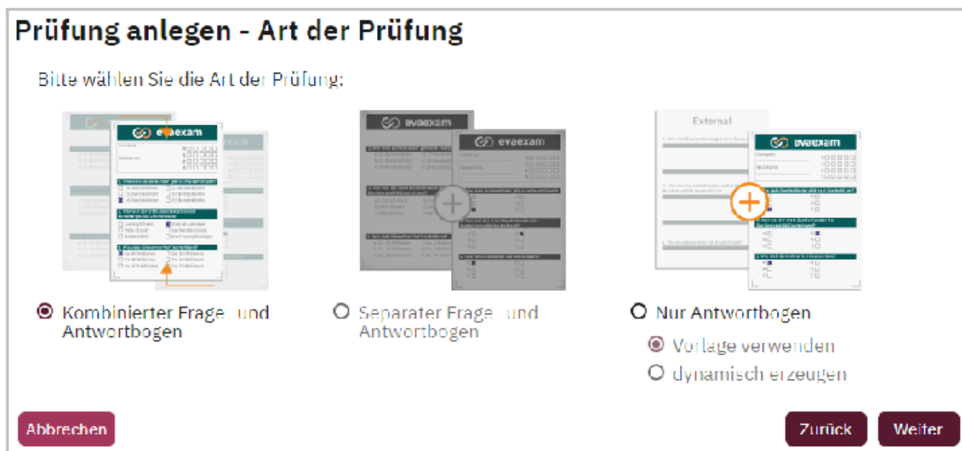
Abb. 3: Art der Prüfungs- und Antwortbögen

Der Wizard stellt Sie nun vor die Entscheidung zwischen zwei Methoden der Teilnehmererfassung . Sie haben die Wahl zwischen der Angabe der Prüfungsteilnehmer-ID durch die Teilnehmenden oder dem TeilnehmerImport .