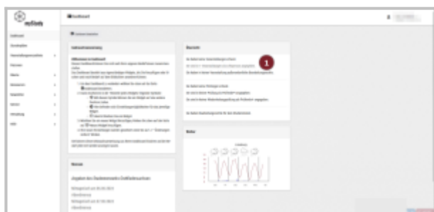
Abb. 1: Veranstaltung wählen

In dem bestehenden Moodle-Kurs werden Rechte, Teilnehmer*innen und Kurseinstellungen nicht verändert. Sofern noch nicht alle Lehrpersonen der neuen Lehrveranstaltung Teacherrechte an dem alten Moodlekurs haben, müssen diese von Ihnen in Moodle als weitere Teacher hinzugefügt werden. Zudem müssen evtl. Teilnehmer*innen, Einschreibemethoden und Einschreibeschlüssel bearbeitet werden.