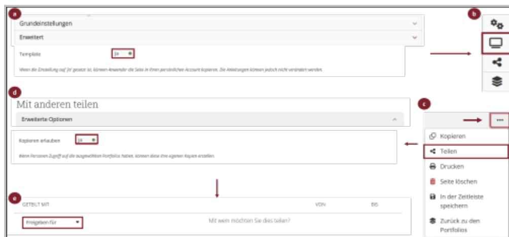
Abb. 2: Prozess der Freigabe von Templates

Sie nun das Template nach Ihren Vorstellungen und speichern Sie die fertige Seite ab. Lassen Sie sich die Seite anzeigen (B) und rufen über das Sticky-Menü (...) Zugriff verwalten auf (C). Dort finden Sie dann unter Erweiterte Optionen die Einstellung Kopieren erlauben (D), damit kann das Template geteilt werden um dann von anderen Nutzer:innen verwendet zu werden.